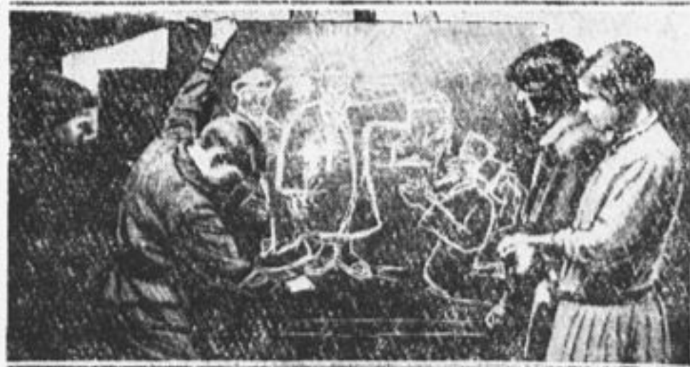
Занятия школьного антирелигиозного кружка. Юный художник «объясняет» небесную иерархию.

Товарищи пионеры города Москвы! Прошу вас, когда будете выбирать место для лагеря, заглянуть к нам. У нас место очень хорошее. С севера деревню защищают горы, есть хорошая питьевая вода, а рядом река Обмора, в которой есть рыба. На берегу можно сделать площадку для игры в баскетбол. Есть хорошие купальные места, в лесах растут грибы и ягоды. У нас много ребят от 7 до 16 лет.