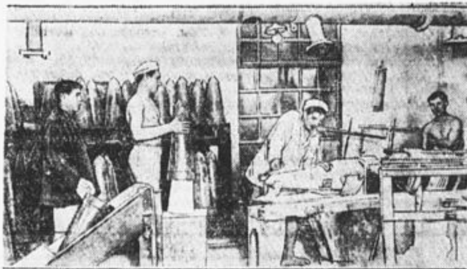
Транспортер для спуска форм в нижний этаж и новая машина для сухой обрезки сахара.

Применение машин делает сахар дешевле и чище. Машины быстрее работают и дают меньше брака.